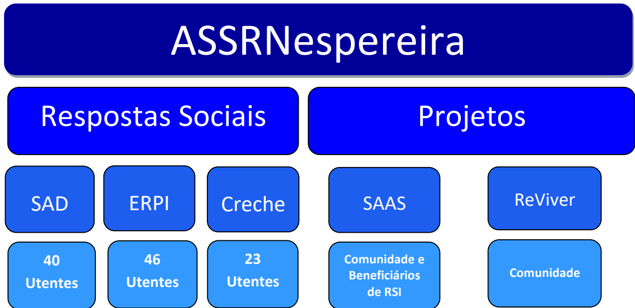
ILUSTRAÇÃO 5 | ÂMBITO DE ATUAÇÃO DA INSTITUIÇÃO – SERVIÇOS E PROJETOS