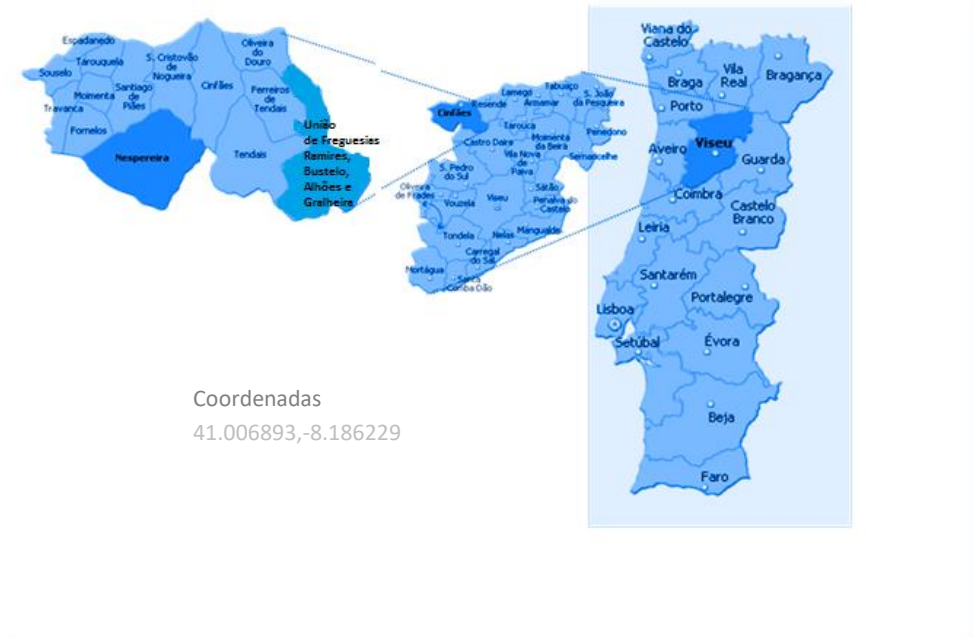
ILUSTRAÇÃO 1| ENQUADRAMENTO DA LOCALIZAÇÃO DA INSTITUIÇÃO

É uma Instituição Particular de Solidariedade Social (IPSS), constituída em 23/05/1995, tendo iniciado a sua atividade em 06/09/1999, com a resposta social de Apoio Domiciliário (SAD), em instalações cedidas pela paróquia.